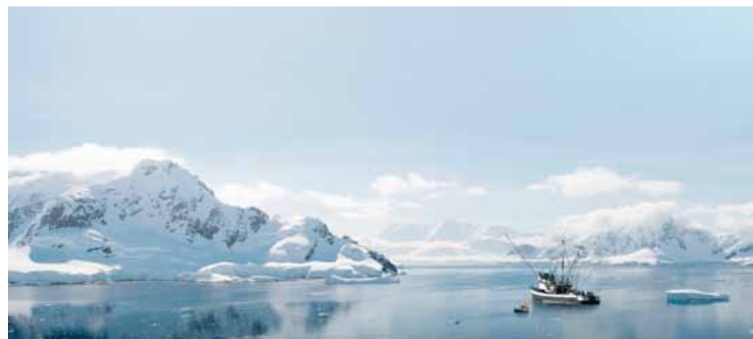
此资料由正谷有机农业技术中心根据网络资料整理而成

深受传统渔业影响，加之与海洋的密切关系，阿拉斯加人明白并深刻了解为后代保护渔业及周边栖息地的必要性。