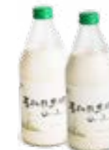
本产品最新批次供应时间约为8月中下旬，详情请关注正谷官方微信oabc_cc。

超市成为丹麦人民购买有机食品的主要渠道，直到2015年，超市占据了有机食品销售的44.1%。