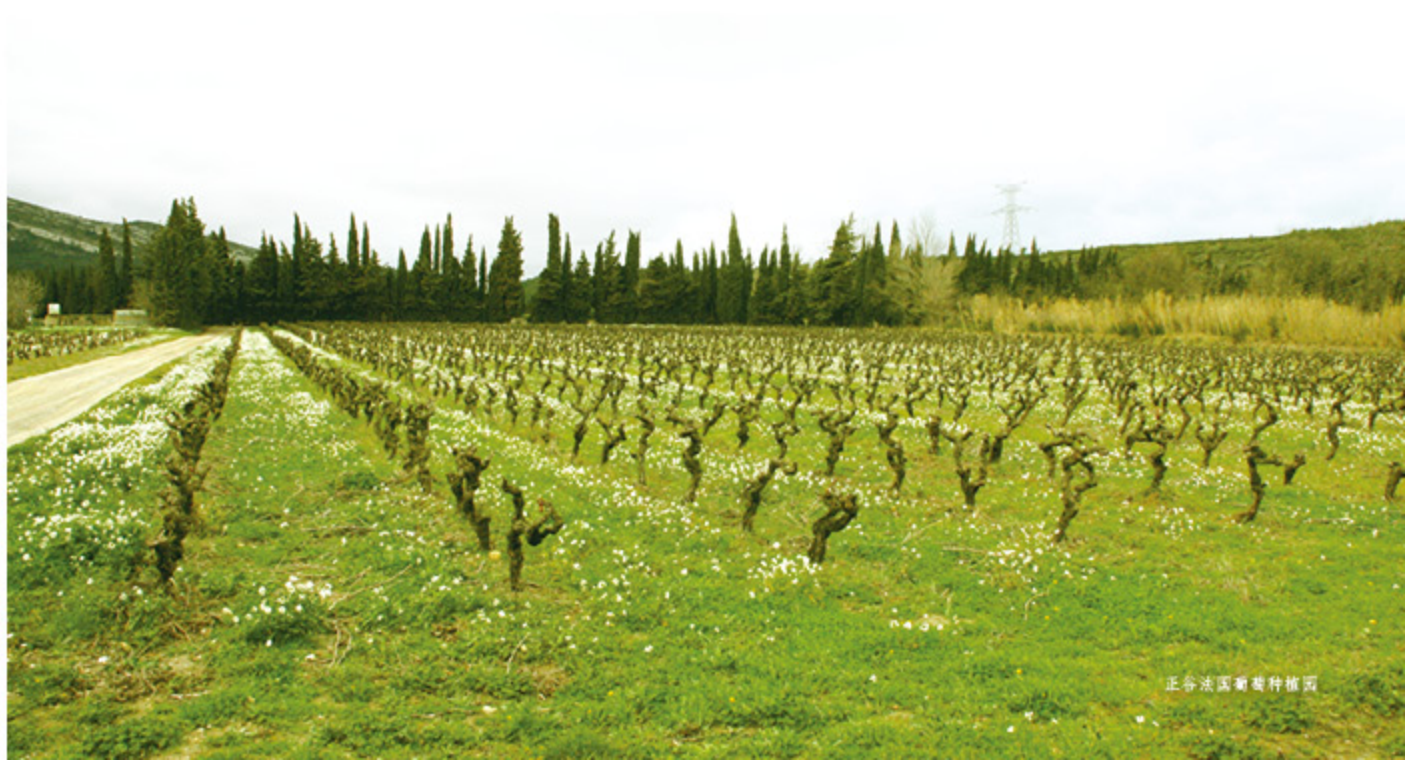
正谷法国葡萄种植园